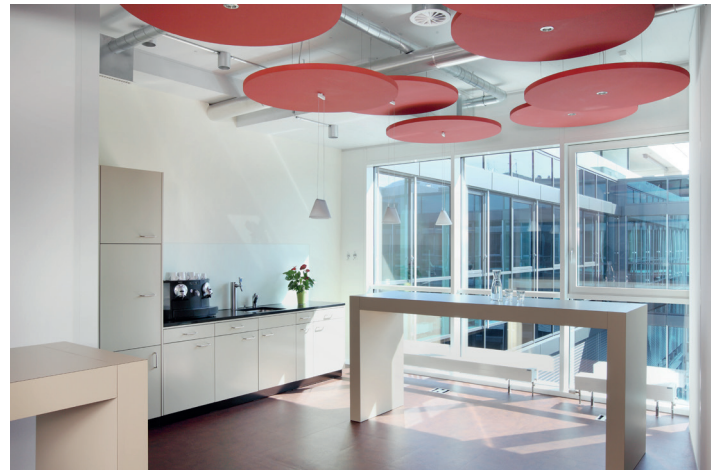
Begegnung: Cafeteria mit Küchenzeile, Longtable und Blick ins Freie