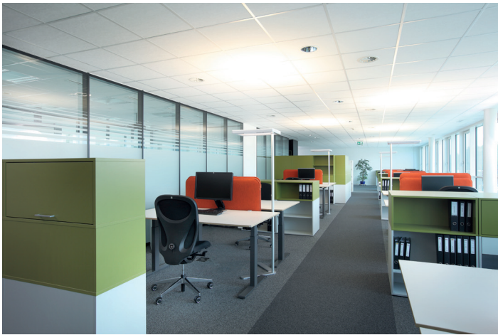
Arbeiten: Lichtdurchflutete Büroarbeitsplätze für Projektleiter

Das neue Office kommt bei unseren Mitarbeitenden sehr gut an! Es ist das angenehmste und schönste Büro, in dem ich bisher gearbeitet habe.»