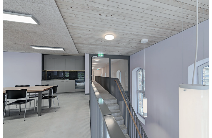
Auf den Gängen finden Patienten und Besucher hübsche Sitzgruppen, die zum Verweilen einladen