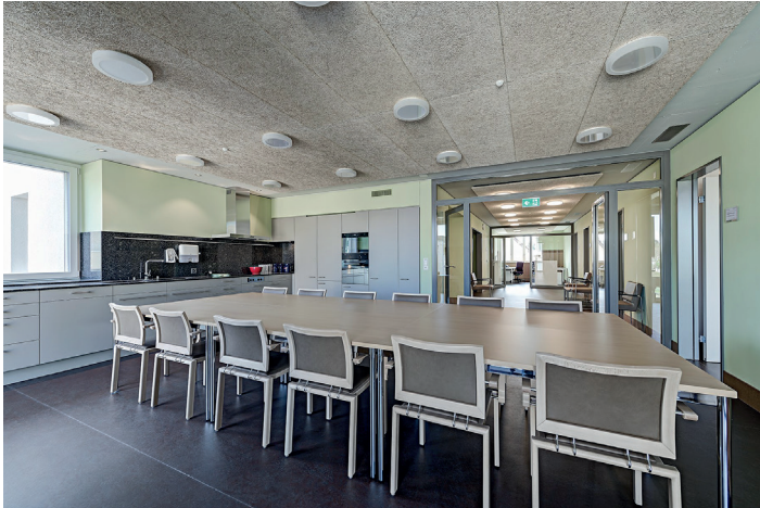
Beim Mobiliar im Aufenthaltsraum wurde auch auf helle Farben Wert gelegt - dadurch wirkt er freundlich und einladend

Wände in Spitälern sind mehrheitlich immer noch weiss - nicht so in der neuen Tagesklinik in Weinfelden. Dort hat man erkannt, dass Farben einerseits den Aufenthalt für Patienten, Pflegepersonal und Besucher angenehmer gestalten andererseits aber auch für therapeutische Zwecke genutzt werden können. Farben haben eine psychische und psychosomatische Wirkung und können das Wohlbefinden der Menschen steigern.